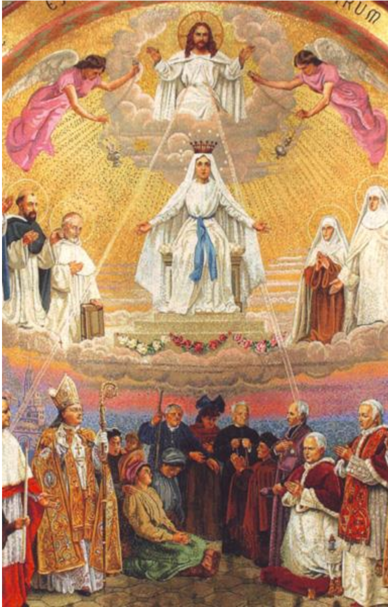
5. Ukoronowanie Najświętszej Maryi Panny na Królową nieba i ziemi.

Królowa po prawicy twojej w ubiorze złotym, otoczona różnaitością (Ps. 44,10).